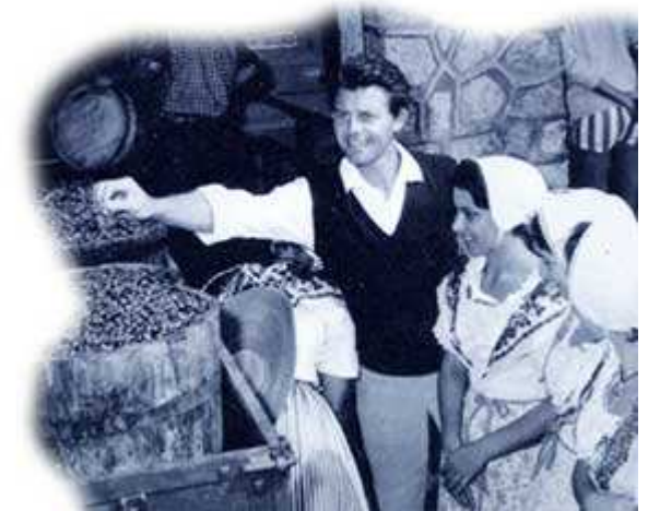
A l'inauguration de la cave coopérative de Ramatuelle

Gérard Philipe s'éteindra au matin du 25 novembre. Il sera enterré, en habit du Cid , dans le cimetière de Ramatuelle ; village où il avait vécu des jours heureux avec sa famille